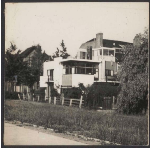
Rietveld Schröderhuis met de witte dakkamer, eind jaren 30